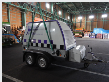
Trail jet 125 d