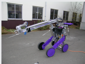
Multi worker 250