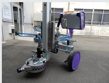
Surface worker 250