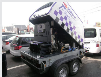
Trail jet 30 d