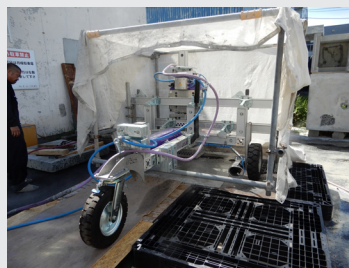
surface rob 250 30-2000-e