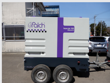
Base jet 125 d